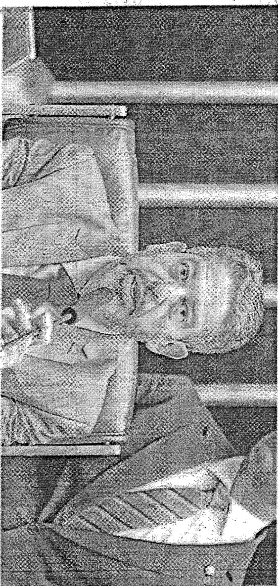
O PRESIDENTE da Câmara, Arthur Lira, participou das negociações em torno da proposta