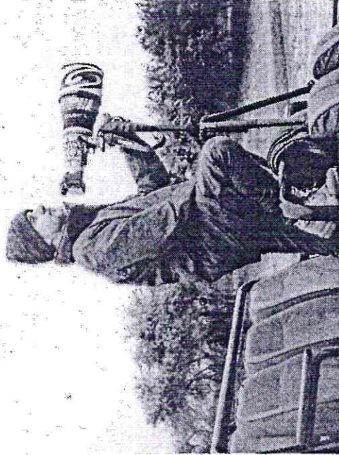
O FOTÓGRAFO Fábio Arruda idealizou a série