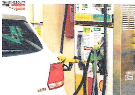
DEABASTECIMENTO afeta, principalmente, distritos mais afastados da zona urbana

No litoral Oeste do Ceará, municípios como Jijoca de Jericoacoara e Cruz estão enfrentando um quadro de desabastecimento de gasolina comum e aditivada há pelo menos cinco dias, conforme relatam motoristas da região.