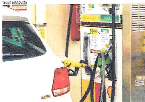
DESABASTECIMENTO afeta, principalmente, distritos mais afastados da zona urbana

Conforme o OPOVO apurou, não há previsão por parte dos postos de combustível de quando a situação será normalizada.