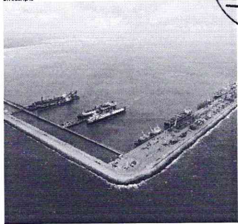
PECÉM é visto como diferencial para a produção de H2V no Ceará

Estado do Ceará - Prefeitura Municipal de Boa Viagem - Resultado de Julgamento de Habilitação - Tomada de Preços Nº 2022.07.11.001. A Comissão Permanente de Licitação da Prefeitura Municipal de Boa Viagem, localizada na Praça Manoel de Jesus, 600 - Centro - Boa Viagem/CE, torna público aos interessados o resultado do Julgamento dos documentos de habilitação do Tomada de Preços Nº 2022.07.11.001. cujo objeto é a Execução dos Serviços de Conservação de Terras Rurais - Rodovia BR-205, uniforme Convênio nº 065/2022, com o Departamento Estadual de Trânsito - Detran/CE, junto a Secretaria de Infraestrutura e Recursos Humanos do Município de Boa Viagem/CE. Licitação (Habilitação): 2 - VAV Construções LTDA, 3 - Máximos Construções e Serviços LTDA (ME), 4 - Construtora Impacto Construtor e Serviços EIRELI, 5 - Sarcos Construções e Locações LTDA (EPP), 7 - Construtora Baía Flor LTDA, 8 - Construtora ALV LTDA (ME), 10 - Estúdios Engenharia EIRELI (EPP), 11 - Eletrôcamp Serviços e Construções LTDA, 12 - ODEPEL (Objeto: Nota Projeto e Empreendimento) LTDA (EPP), 14 - Construtora Almas LTDA (EPP) e 16. M A Falcão de Sousa LTDA (EPP). Licitação (Habilitação): 1 - C. R. F. Costa Construções de Engenharia e Locações EIRELI (EPP) e 17 - WJ Construções e Serviços EIRELI. Para obter o preceito recorre ao item 106, inciso II, alínea "a" da Lei nº 8.988/93. Boa Viagem/CE, 04 de agosto de 2022. CPL.