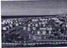
REFINARIA Lubnor no bairro Vicente Pinzón, em Fortaleza