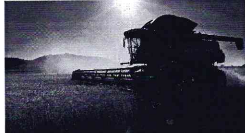
No Brasil, exportação de trigo já gera superávit

O secretário de Comércio da Índia, B.V.R. Subrahmanyam, disse a repórteres ontem, 15, que o governo manterá uma janela aberta para exportar trigo para países com déficit alimentar, apesar das restrições anunciadas dois dias antes. O país também permitirá que empresas privadas cumpram compromissos anteriores de exportar quase 4,5 milhões de toneladas de trigo até julho.