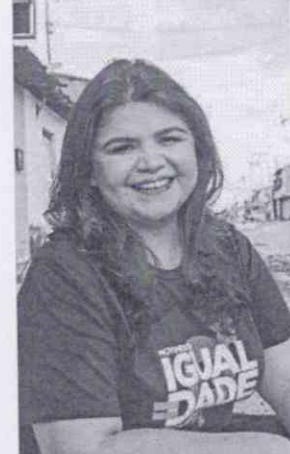
ADELITA é pré-candidata do Psol ao Governo do Ceará