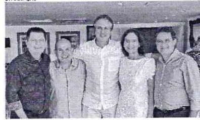
CAMILO tirou foto com os pré-candidatos do PDT ao governo

Em meio às tratativas para definição do nome do PDT para representar as forças governistas na disputa pelo Palácio da Abolição, o governador Camilo Santana (PT) publicou na tarde deste domingo (ao) foto em que aparece ao lado dos cotados.