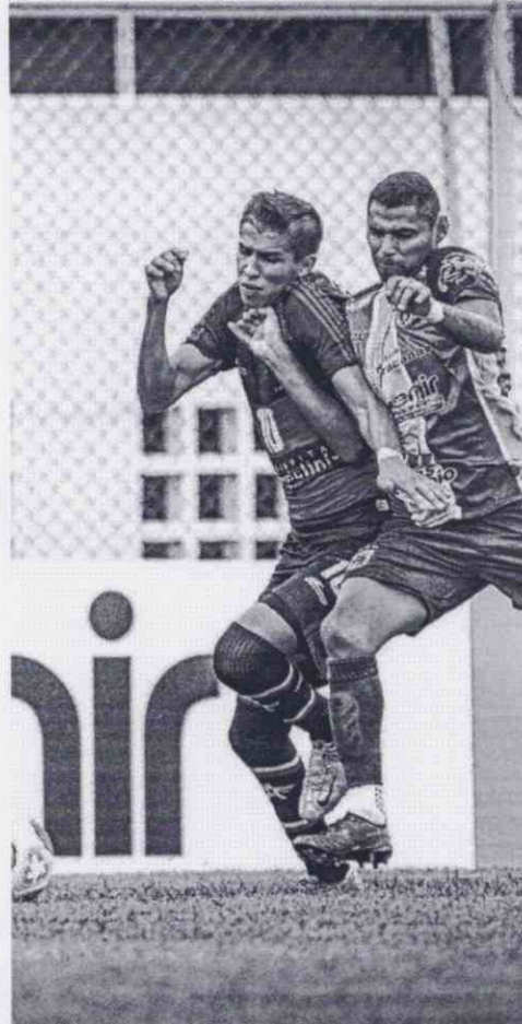
9 GOLS foram marcados na primeira rodada