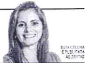
ESTA COLUNA É PUBLICADA ÀS SEXTAS

POR JOELMA LEAL Jornalista e especialista em Marketing