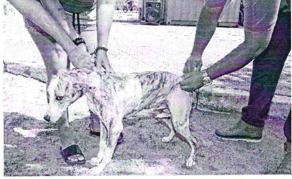
VACINA é aliada indispensável na prevenção contra calazar

LAIS OLIVEIRA ESPECIAL PARA O POVO cotidiano@opovo.com.br