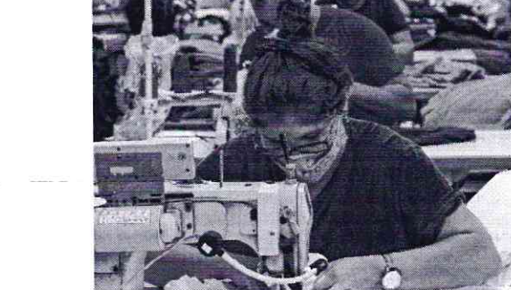
No Ceará, a indústria têxtil é um dos principais setores beneficiados pela prorrogação

Os 17 setores beneficiados são calçados, call center, comunicação, confecção/vestuário, construção civil, empresas de construção e obras de infraestrutura, couro, fabricação de veículos e carrocerias, máquinas e equipamentos, proteína animal, têxtil, tecnologia da informação (TI), tecnologia de comunicação (TIC), projeto de circuitos integrados, transporte metropolitano, transporte rodoviário coletivo e transporte rodoviário de cargas.