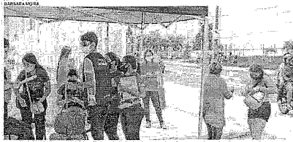
Movimentação fraço nos locais de prova do Enem Digital

ESTADO DO CEARÁ - PREFEITURA MUNICIPAL DE SOBRAL - AVISO DE LICITAÇÃO Nº 017/2020 - PROCESSO Nº 017/2020 - TIPO DE LICITAÇÃO Nº 017/2020 - OBJETO: AQUISIÇÃO DE MATERIAIS PARA OBRAS DE REFORMA E MANUTENÇÃO DE BARRACÃO DE ALUGADO DO MUNICÍPIO DE SOBRAL - CEARÁ - VALOR ESTIMADO DE R$ 1.000.000,00 (UM MILHÃO DE REAIS) - DATA DE ABERTURA DE ENCOMENDAS ÀS 14H00 (CATORZAS HORAS) DO DIA 14/03/2020 - LOCAL DE ABERTURA: SALA DE LICITAÇÃO Nº 017/2020 - ENDEREÇO: RUA DEBILITADO Nº 100 - SOBRAL - CEARÁ - CEP: 62010-000