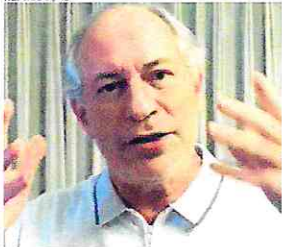
CIRO Gomes: inquérito instaurado pela PF