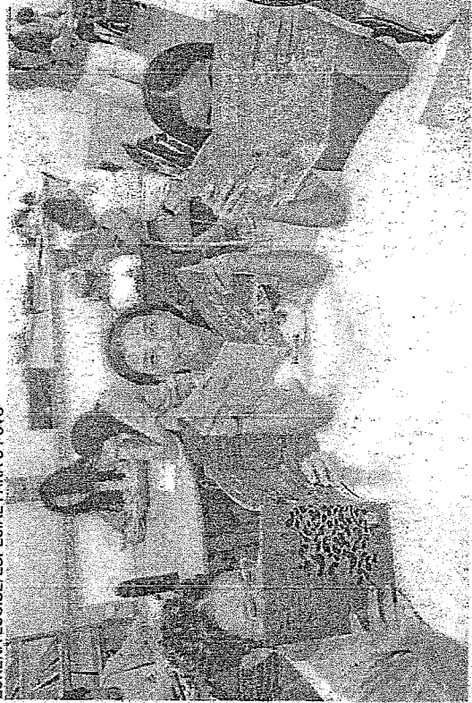
AS matrículas na Rede de Ensino podem ser realizadas ao longo de todo o ano