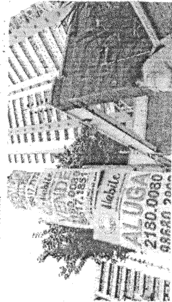
BÁRBARA DE MOURA (2020)